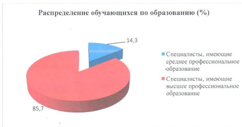
Рисунок 1. Распределение обучающихся по уровню образования

Распределение обучающихся по уровню образования представлено на Рисунке 1.