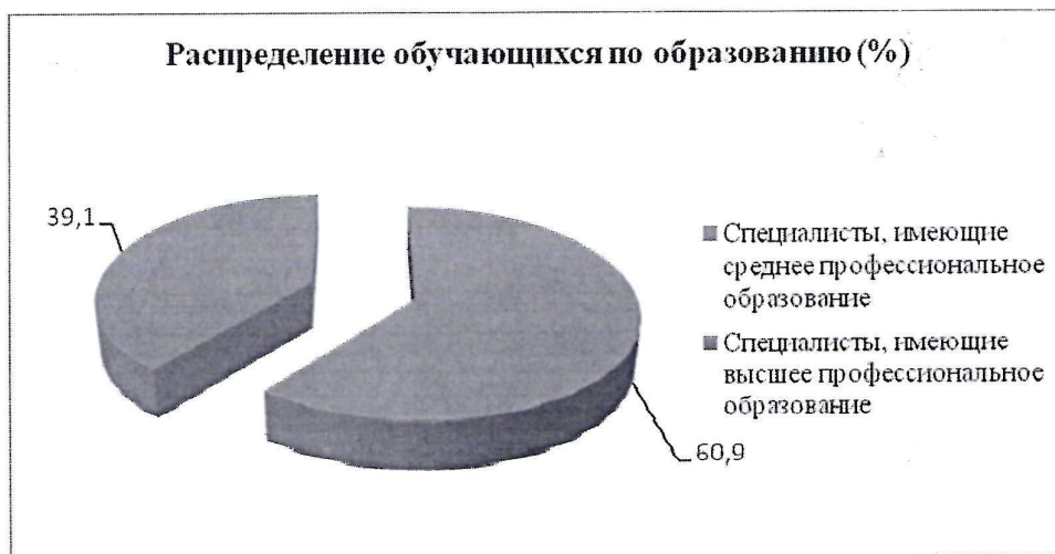
Рисунок 1. Распределение обучающихся по уровню образования

Распределение обучающихся по уровню образования представлено на Рисунке 1.